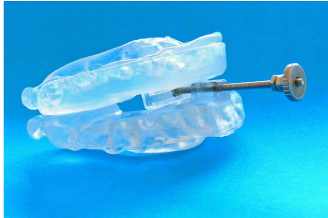
Abb. 2: Ober- und Unterkieferschale mit Justierschraube