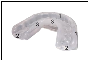
Abb. 2: Oberkieferschale