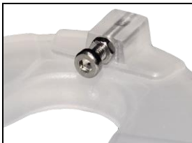
Abb. 4: Justierschraube