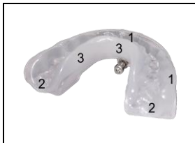
Abb. 3: Unterkieferschale