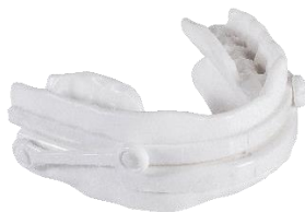
Verbinder aus dem Set ( ohne Schrauben)